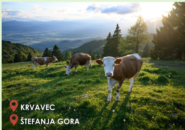
KRVAVEC ŠTEFANJA GORA