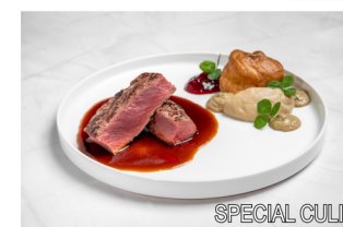
SPECIAL CULINARY EXPERIENCE