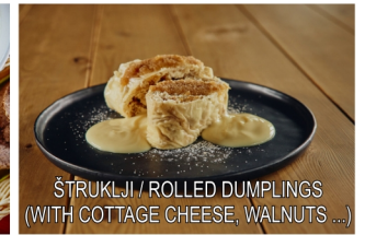
ŠTRUKLJI / ROLLED DUMPLINGS (WITH COTTAGE CHEESE, WALNUTS ...)