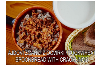
AJDOVI ŽGANCI Z OCVIRKI / BUCKWHEAT SPOONBREAD WITH CRACKLINGS