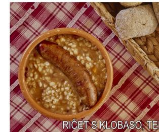
RIČET S KLOBASO, TELEČJA OBARA / BEEF STEW