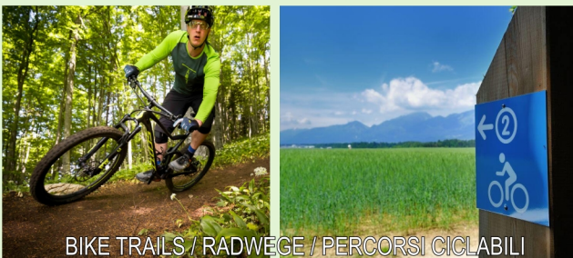
BIKE TRAILS / RADWEGE / PERCORSI CICLABILI