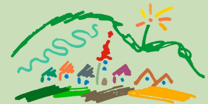
Cerklje pod Krvavcem