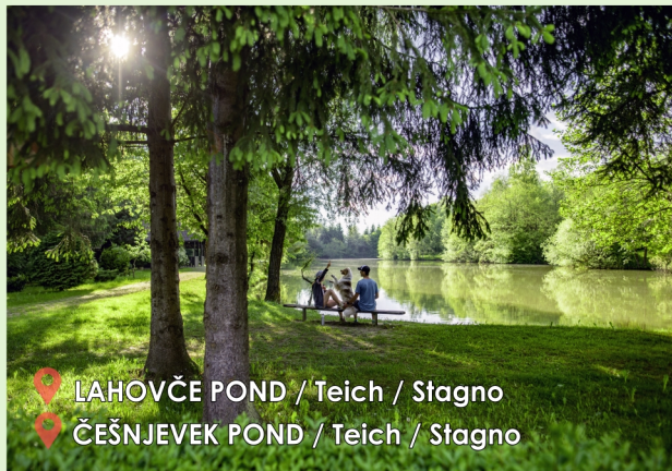
LAHOVČE POND / Teich / Stagno ČEŠNJEVEK POND / Teich / Stagno